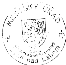
Lubor Kašpar referent odboru výstavby a životního prostředí oprávněná úřední osoba [otisk úředního razítka]

Společné povolení má podle § 94p odst. 5 stavebního zákona platnost 2 roky. Stavba nesmí být zahájena, dokud rozhodnutí nenabude právní moci.